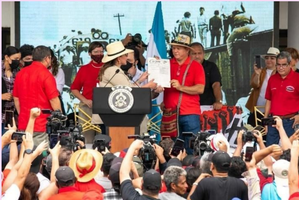
Irís Xiomara Castro, presidenta de la República de Honduras. Junio de 2022

“Este gobierno que estoy iniciando está comprometido con la libertad sindical, la contratación colectiva, el aumento de los trabajadores al seguro social, la Ley de consulta previa a los pueblos indígenas y originarios en sus pueblos ancestrales respecto a sus tierras y territorios que habitan. Apoyaremos los derechos del trabajo doméstico y combatiremos la violencia y el acoso en el mundo del trabajo, usando el diálogo como el mejor instrumento de la democracia”