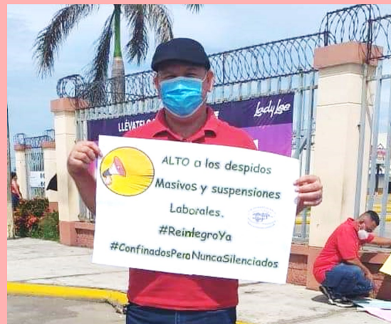
Fotografía captada durante la pandemia Año 2020. Pese a que la crisis por Covid19 se agudizaba, el movimiento sindical hondureño no dejó de manifestarse en las calles.