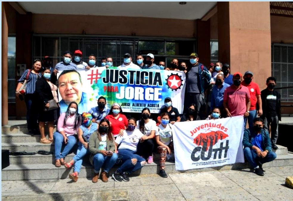
tomada en las instalaciones del Ministerio Público en la ciudad de Tegucigalpa, M.D.C en 2021